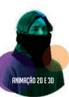
ANIMAÇÃO 2D E 3D