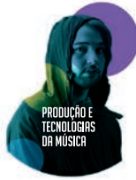
PRODUÇÃO E TECNOLOGIAS DA MÚSICA